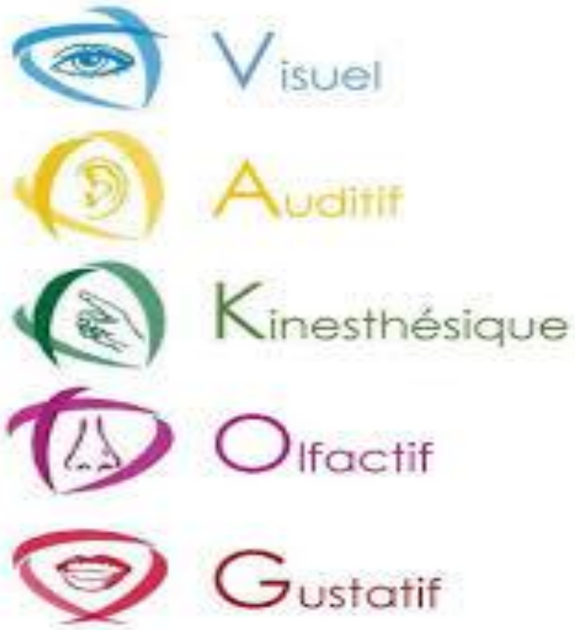
Schéma représentant le système VAKOG